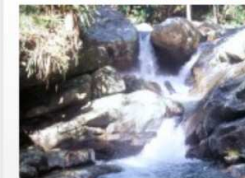
Hino de Camboriú