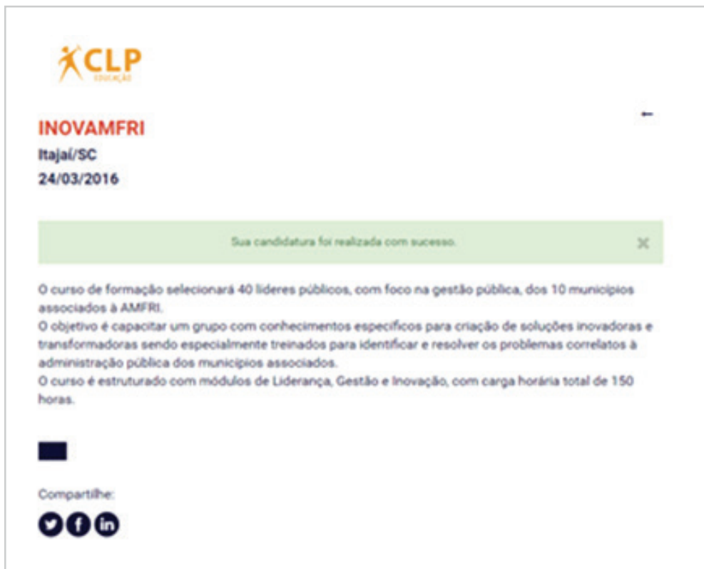
Figura 7 - Imagem de Confirmação de Candidatura