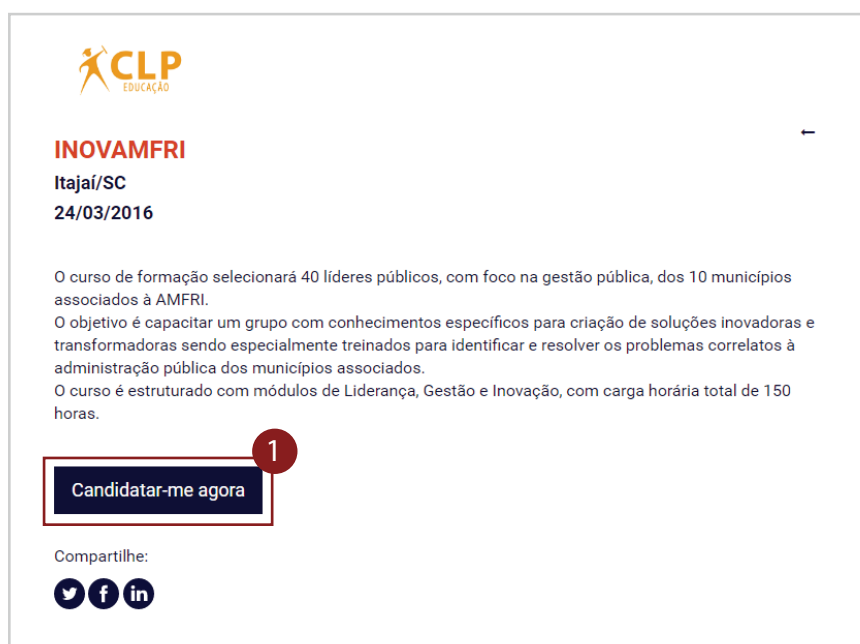
Figura 3 - Acesso à Plataforma