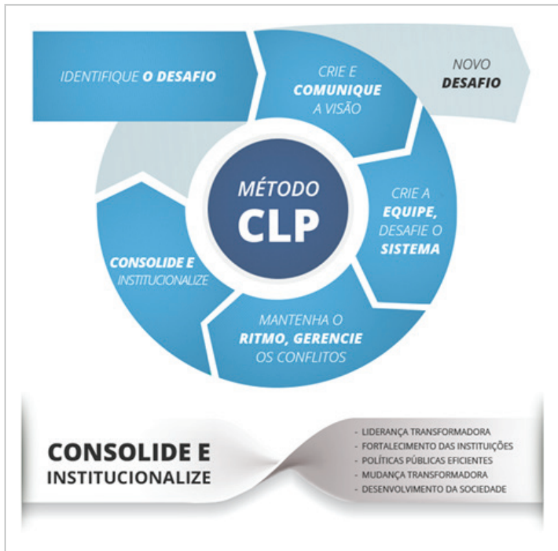
Figura 2 - Metodologia CLP