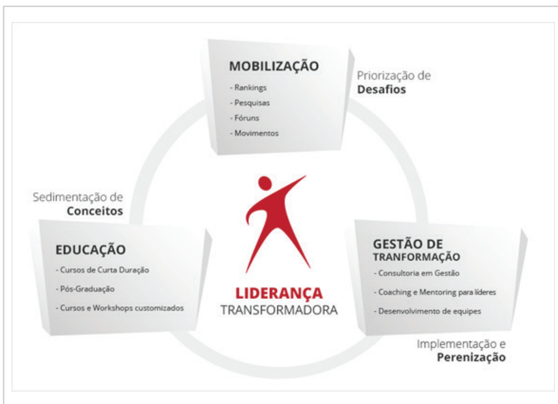
Figura 1 – Áreas e Modelo de Atuação do CLP

Liderança ética e eficaz é o ponto de partida para as mudanças transformadoras na gestão pública e no fortalecimento das instituições democráticas. Consideramos mudanças transformadoras aquelas que exigem mudanças de crenças, de atitudes e de costumes arcaicos. O verdadeiro desafio de liderança é promover mudanças de comportamento e de cultura.